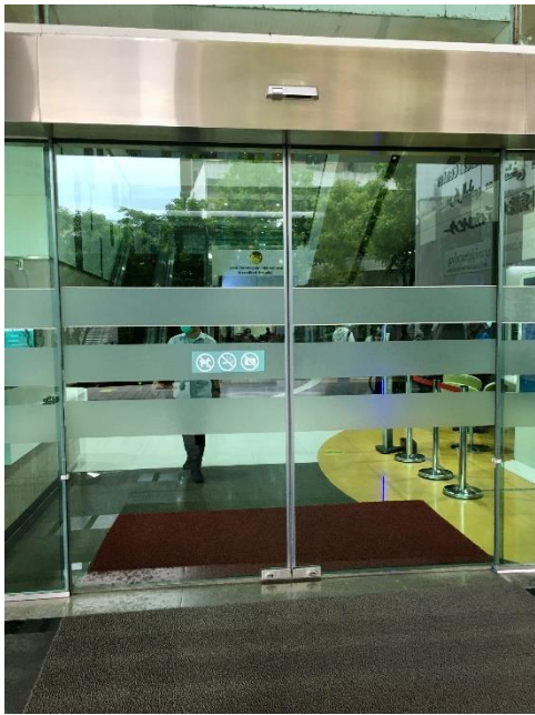
1. 病院の入り口です。(ประตูทางเข้าโรงพยาบาล)

検査までの流れは以下になります(สถานที่ใหม่และขั้นตอนตามรูปภาพด้านล่าง)